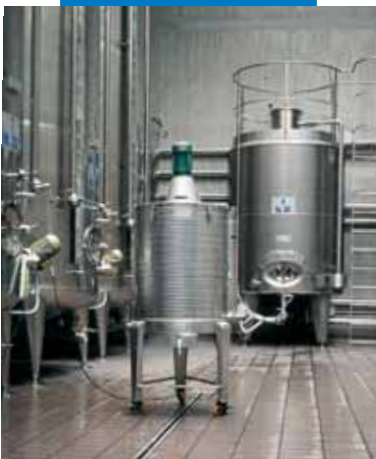
Пример заделки швов в винном производстве