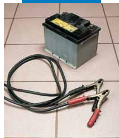
Пример заделки швов в мастерской автоэлектротехника

Смесь готовится так, как описано выше: два компонента смешиваются и наносятся на основание выбранным зубчатым шпателем. Для обеспечения хорошего контакта с клеем