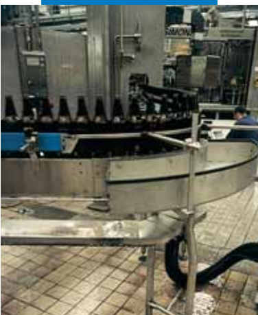
Пример заделки швов в пивном заводе