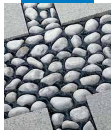
Пример заделки швов пола с каменным орнаментом