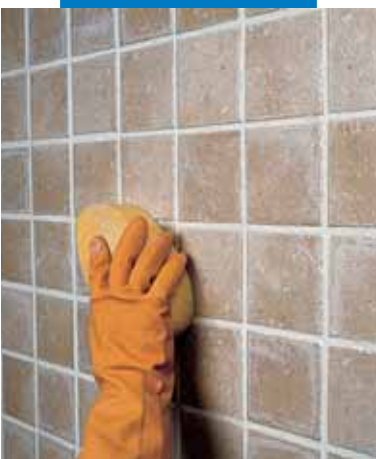
Отделка плитки одинарного обжига губкой