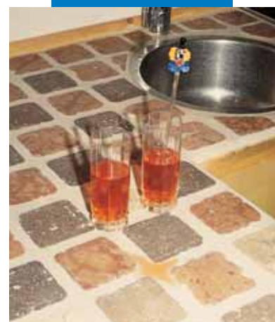
Пример приклеивания и заделки швов на кухонной стойке