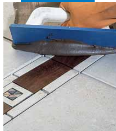
Заделка мастерком швов керамического пола с деревянной вставкой