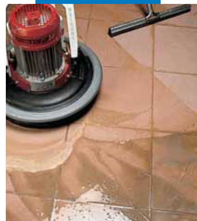
Отделка фаянсовых полов монощеткой со скребком