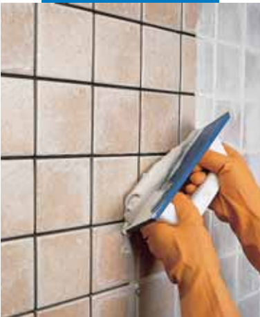
Заделка швов плитки одинарного обжига мастерком