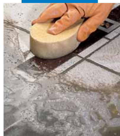
Отделка губкой керамического пола с деревянной вставкой