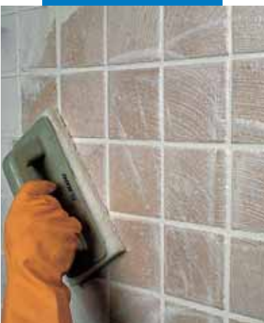
Отделка плитки одинарного обжига теркой Scotch-BriteR